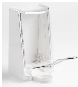
Vare nr. 4567