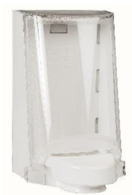
Vare nr. 4551