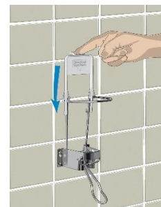
Vare nr. 9500 Dispenser Vare nr. 9500 Bøjle til dispenser