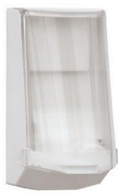
Vare nr. 4546 Automatisk dispenser